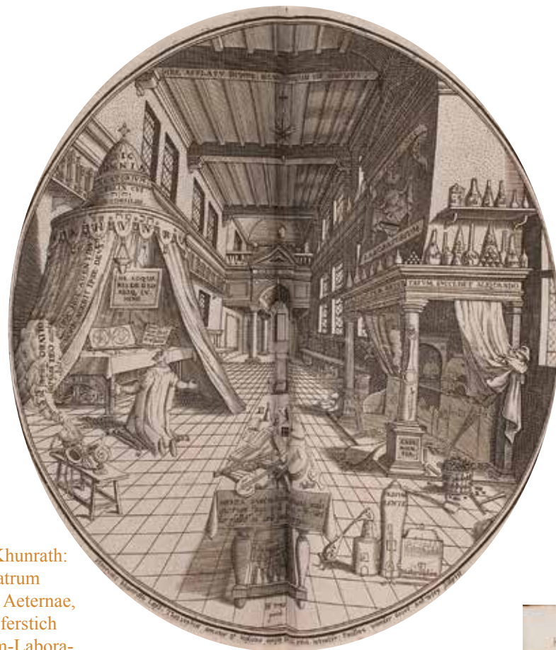
Heinrich Khunrath: Amphitheatrum Sapientiae Aeternae, 1653, Kupferstich „Oratorium-Labora- torium“

Welt fest zu etablieren beginnt. Gerade für das, was in den Verifikationen und Falsifikationen der modernen Naturwissenschaft verloren ging, stellte die Alchemie auch weiterhin eine facettenreiche Bildsprache bereit, die je nach Zugang und Zeitalter neu kulturell ausgeschöpft wurde und die auch noch in unserem Alltag Spuren hinterlassen hat. Die Ausstellung