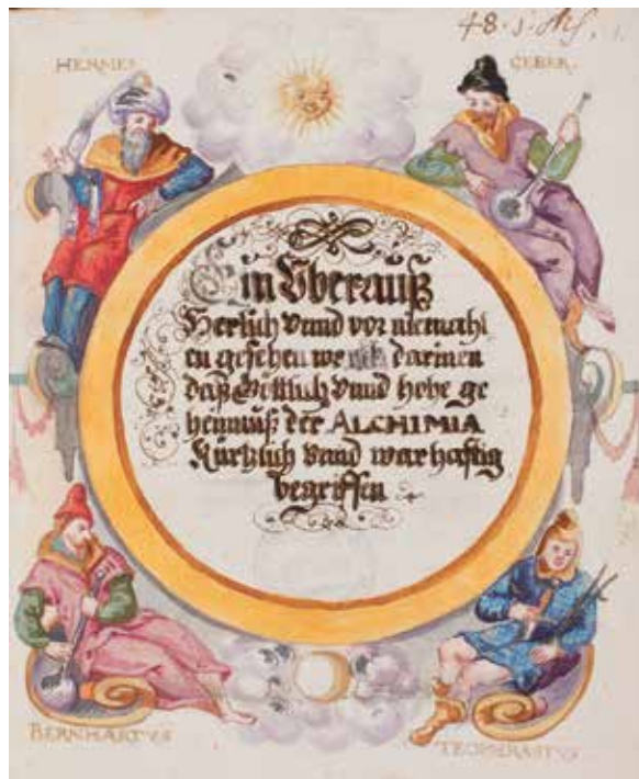
Alchemische Autoritäten, Papierhand- schrift, 16. Jh.

präsentiert die Quellen in drei Abschnitten: In der Augusteerhalle kommen unter dem Titel Phänomene und Kontexte der Alchemie Grundlagen zur Entfaltung. In der Schatzkammer werden Bild und Text in alchemischen Handschriften gezeigt und im Kabinett öffnen sich Einblicke in das alchemische Laboratorium .