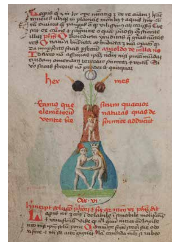
Donum Dei, Pergamenthandschrift, 15. Jh.

Wenn es auch nie gelungen ist, Blei zu Gold zu veredeln oder die Formel der Unsterblichkeit zu finden, wurden dennoch in den alchemischen Laboratorien Wege zur Chemie gebahnt. Viele Sucher nach dem Stein der Weisen waren im Bergbau, in der Metallurgie und in der Töpferei an praktischen Entdeckungen beteiligt. Die Destillation von Alkohol geht auf alchemische Versuche zurück. Alchemiker entdeckten Schwefel- und Salpetersäure und Ammoniak. Ohne vom Ziel der Goldumwandlung abzulassen, fand Johann Rudolf Glauber 1653 das nach ihm benannte Heilmittel Glaubersalz (Natriumsulfat). Der Glasmacher Johann Kunckel machte sich durch die Herstellung von Rubinglas und Kristallfabrikaten einen Namen, Johann Friedrich Böttger schließlich ging als Erfinder des Porzellans, des „weißen Goldes“, in die Geschichte ein. Zwischen dem barocken Hof – der sein Dasein als eine prunkvolle Bühne begriff und stets neue Einnahmequellen erschließen wollte – und den Alchemikern, die den Eindruck