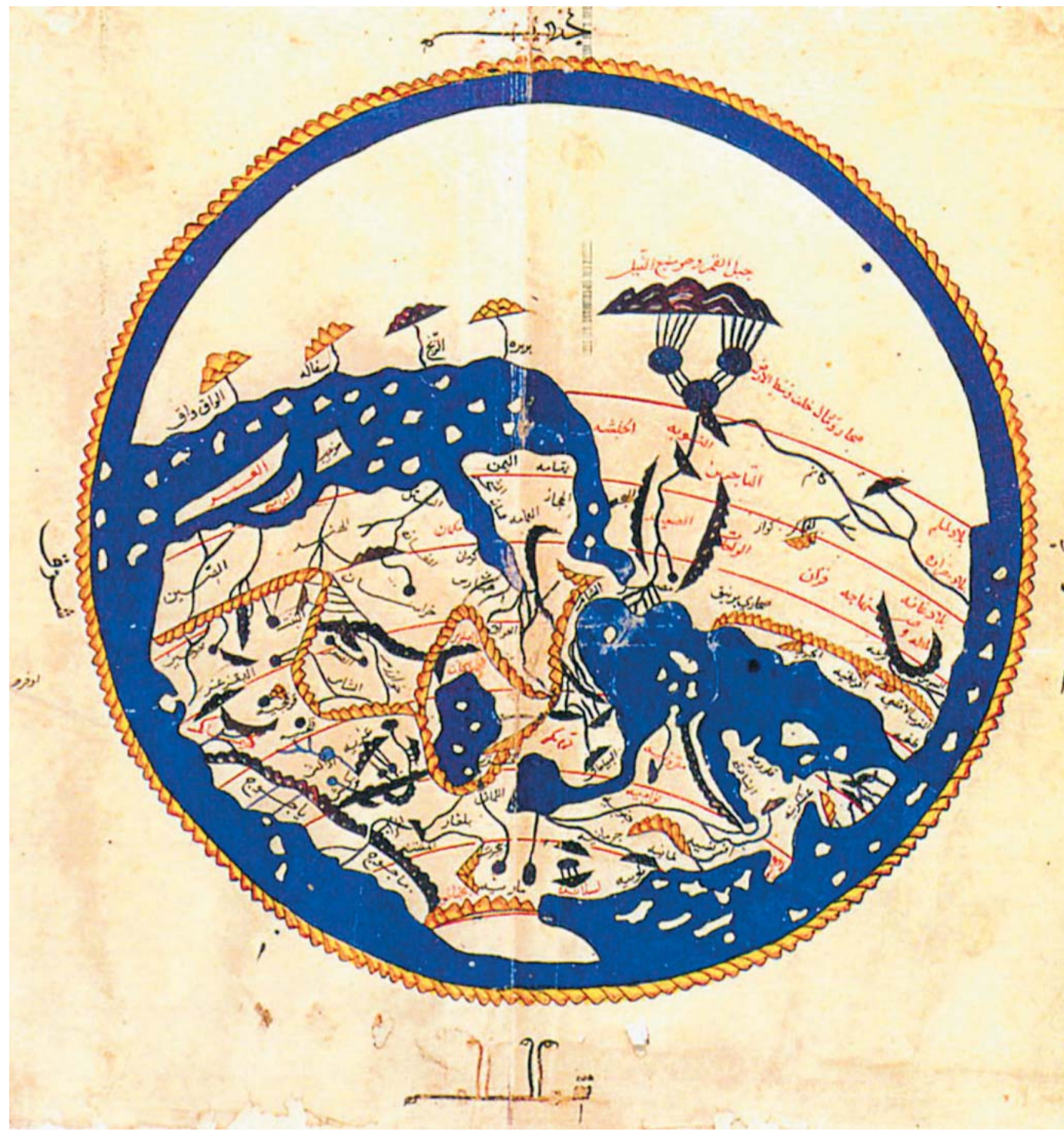
Die Weltkarte des in Spanien geborenen, am normannischen Hof in Sizilien für Roger II. wirkenden, sehr vielseitigen Naturforschers Abu Abdullah al Idrisi zeigt den Süden oben.